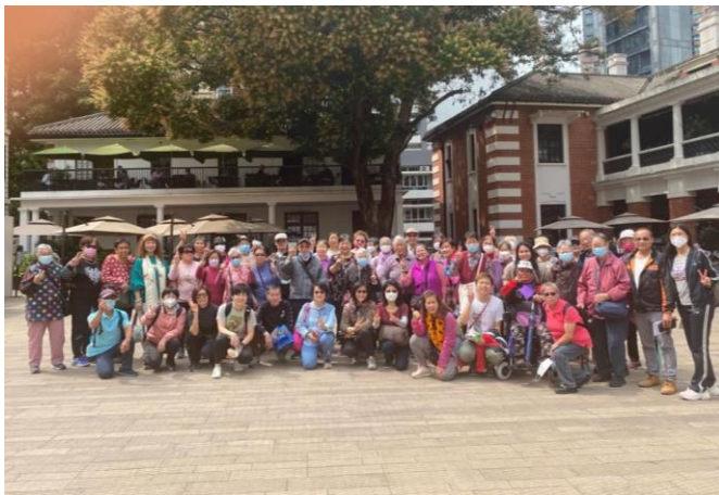
舊地重遊——香港區(大館)

另外，透過社署福利處其下的老有所為計劃，我們以「聚舊匯新跨代情」為主題，完成已編定的「舊地重遊——香港區(大館)、九龍區(寨城公園及牛棚)及懷舊時裝 Show」，但因申請數目有餘，所以增添多兩個項目給長者，「跨朝聖經文物館」和「鶴藪燒烤樂共融」，讓長者與年與年輕一代互動、增進彼此了解，更可與社區保持聯繫，提升身心健康。