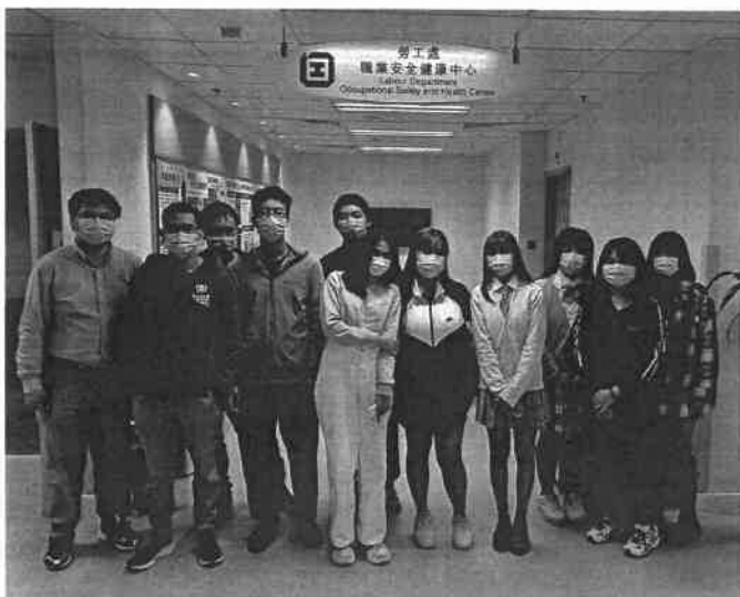
◆ 學員於職業安全健康診所參予工作坊

青少年是香港的未來社會棟樑。為讓青少年發展潛能，為未來事業作好準備，本會透過勞工處「展翅青見計劃」為 15 至 24 歲離校青少年提供理論與實踐結合的職前培訓及工作實習，使青少年在融入社會及投身勞動市場前作好準備，同時亦提供個人化的擇業導向、職業諮詢、在職支援服務等，以協助他們確認個人發展需要，將潛能轉成優勢，向目標進發。