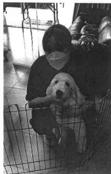
◆ 學員與完成寵物美容後的狗兒留影