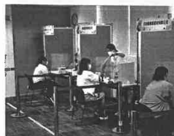
◆「青年培訓及就業博覽 2022」為區內有需要人提供就業機會

自 2015 年，中心定期為區內特別服務對象舉辦「職場再出發實戰系列」、「僱人實戰系列」、「新來港人士就業實戰系列」及「青年就業實戰系列」等系列活動，以一條龍活動系列為特色，配以不同的行業主題，讓參加者透過參與「職志分析及就業規劃工作坊」、「行業講座」、「工作體驗日」及「招聘活動」，協助他們深入了解就業市場的最新情況，掌握工作所需的技能，為有興趣投身相關工作的參加者提供就業機會。