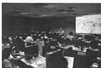
◆中心定期邀請僱主為會員介紹最新行業狀況。

中心持續以「就業從學校出發」為導向，積極與區內學校加強協作，多年來已為 40 多間中學的準離校生提供求職技巧講座及行業體驗工作坊，強化學生的職業教育及就業資訊，讓他們在踏進工作世界前作充足的準備。