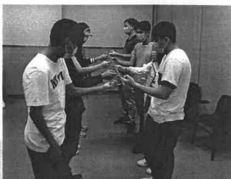
◆ 團隊協作上課情況