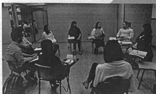
◆ 與僱主代表作小組討論