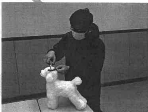
◆ 寵物美容課程實習情況

本會推行「展翅青見計劃」多年，在展翅學員意見調查中有多個訓練課程皆排行榜首。本會亦有多個課程獲得榜首冠軍的殊榮，包括核心課程、電腦應用、網頁製作及圖像處理、專業寵物美容師課程。而 2021-2022 年度參加本會展翅青見計劃的學員已經超過 1,000 人，其中成功就業的更高達 80%，成績斐然。