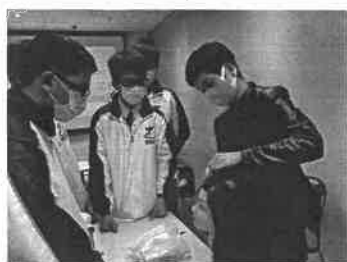
◆學生透過行業體驗工作坊，切身體會各行業的工作狀況。