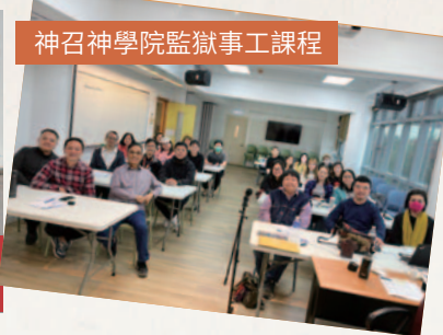
神召神學院監獄事工課程