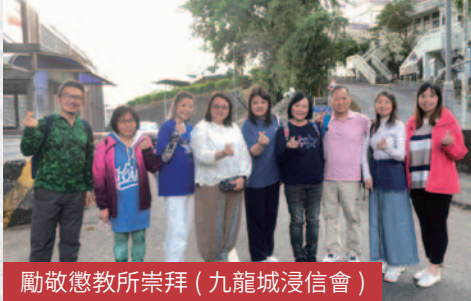
勵敬懲教所崇拜 (九龍城浸信會)