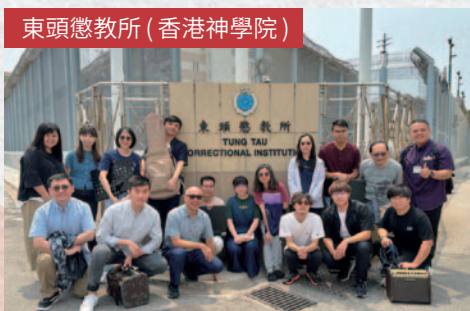
東頭懲教所 (香港神學院)