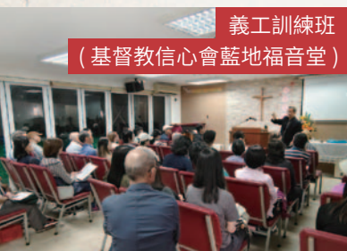
義工訓練班 (基督教信心會藍地福音堂)

監獄福音事工不僅是傳福音，更是實踐基督「愛與赦免」的使命。透過系統化的訓練，我們能更有效地幫助在囚人士生命轉化，並在他們回歸社會時給予持續的支持。盼望更多教會與信徒回應這份呼召，共同見證福音的大能。