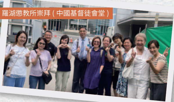
羅湖懲教所崇拜 (中國基督徒會堂)