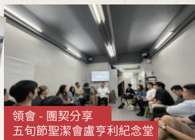
領會 - 團契分享 五旬節聖潔會盧亨利紀念堂