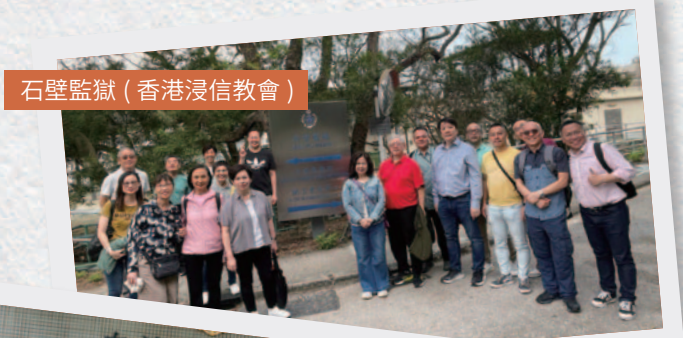
石壁監獄 (香港浸信教會)

院所囚禁未滿 21 歲的年輕女孩，我們每月有兩場崇拜，給兩班未判刑的女孩子參加，另外還有一年一次節期全院綜合佈道聚會。2024 全年參與我們聚會的在囚少女約有 340 人次。還很青澀跳脫的少女，在院所內除了等候判刑，也有工作的機會，學習自律，在我們的耳濡目染下，慢慢聽了很多基督徒信主的見證，使她們都很好奇和有所啟發，部份甚至因報讀我們的聖經課程而信主，對生活有很好的反思。即使她們大多數仍然各自有著不同的信念，但感恩的是教會弟兄姊妹都能夠與她們真誠的交流，撒下福音的種籽在她們的心中。對於隨著年歲增加而轉到成人懲教所的女孩，感恩我們也可以在院所繼續關心和牧養她們。 願她們的心更多的向神開啟，生活有主同行和喜樂，改寫人生的道路。