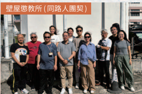
壁屋懲教所 (同路人團契)