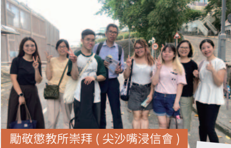
勵敬懲教所崇拜 (尖沙嘴浸信會)