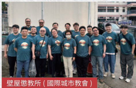
壁屋懲教所（國際城市教會）