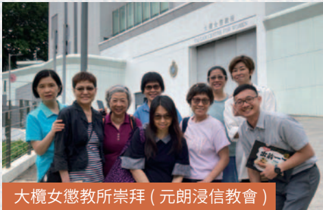
大欖女懲教所崇拜 (元朗浸信教會)