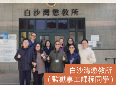
白沙灣懲教所 (監獄事工課程同學)