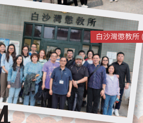
白沙灣懲教所 (神召神學院)