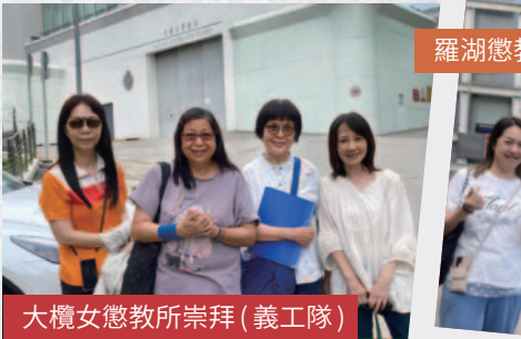
大欖女懲教所崇拜 (義工隊)