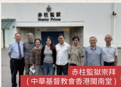
赤柱監獄崇拜 (中華基督教會香港閩南堂)