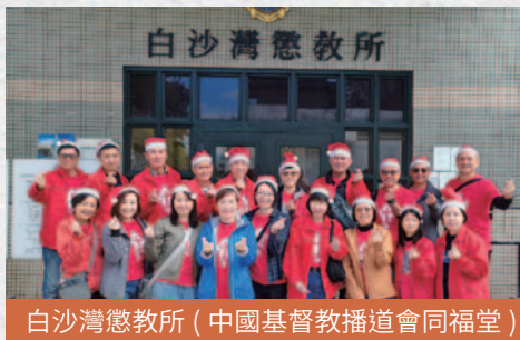
白沙灣懲教所（中國基督教播道會同福堂）