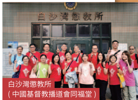
白沙灣懲教所 (中國基督教播道會同福堂)