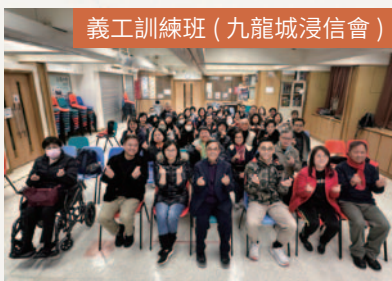
義工訓練班 (九龍城浸信會)