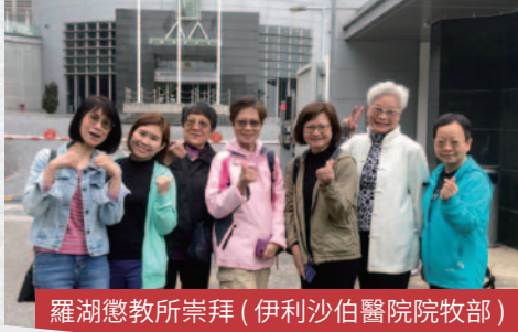
羅湖懲教所崇拜 (伊利沙伯醫院院牧部)