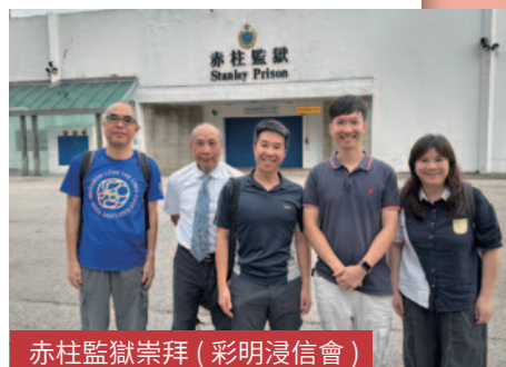
赤柱監獄崇拜 (彩明浸信會)

除恆常監獄探訪及聚會外，今年我們在節日裡與 11 間教會及團體，在不同院所中共舉行了 68 場全院綜合佈道聚會。感謝各位弟兄姊妹的參與，發揮恩賜，將「好消息」分享給在囚朋友。