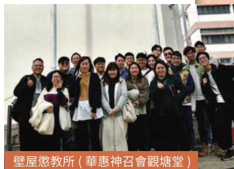
壁屋懲教所 (華惠神召會觀塘堂)