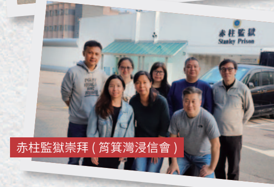
赤柱監獄崇拜 (筲箕灣浸信會)