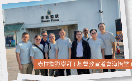
赤柱監獄崇拜 (基督教宣道會海怡堂)

游走在香港懲教院所探訪是牧者們的日常，全年累計探訪至少二千人次，見證著人性的光輝與軟弱，見證神總對倚靠祂的人賜下恩典，即使處於艱難中，我們卻親眼見證不少人真心信主後有極大的平安和盼望。2024年見到特別多涉及詐騙案件的囚友，其中不乏被騙子利用的受害者。求主繼續使用我們成為祂流通祝福的管道，將主愛和福音注入在他們的生命中。