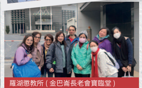
羅湖懲教所（金巴崙長老會寶臨堂）