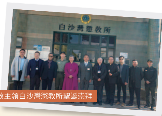
聖公會大主教領白沙灣懲教所聖誕崇拜

12月19日本會邀請了香港聖公會陳謳明大主教主持白沙灣懲教所舉行聖誕崇拜，為在囚人士帶來聖誕節盼望信息。