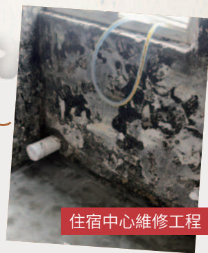
住宿中心維修工程

由於住宿中心的樓齡較大及原有的內部裝修設施漸趨殘舊，今年其中一間中心去水問題進行了大維修，重造防水層、翻新水喉及潔具，讓宿友能有合宜的地方繼續居住。另一間女性中心今年也進行了清理簷篷工程。感謝主的帶領，工程一切順利。求主繼續使用住宿中心，讓更生人士有一個暫時安身之所。