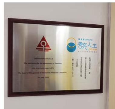
本會鳴謝華永會捐助的牌匾