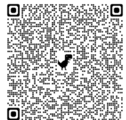
報告全文及行政摘要