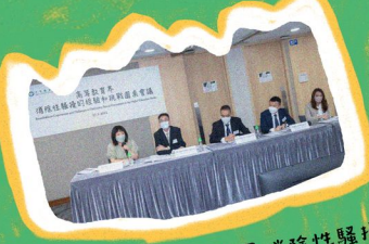
平機會「高等教育界消除性騷擾的 經驗和挑戰圓桌會議」