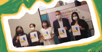
大專院校防止性騷擾政策調查 2021-22