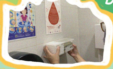
Drop Spot 經血來潮支援站