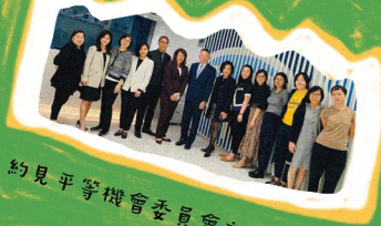
約見平等機會委員會主席及職員