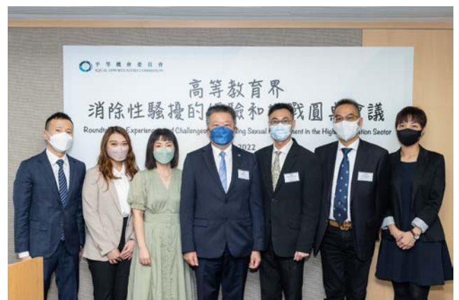
平機會「高等教育界消除性騷擾的經驗和挑戰圓桌會議」

此外，本會亦可為團體提供協助制訂反性騷擾政策的工作坊或協助草擬政策文件，歡迎與本會聯絡。