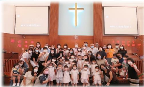
2022年10月·本校學生與家長參與香港華人基督會教育主日·並以詩歌獻上頌讚。