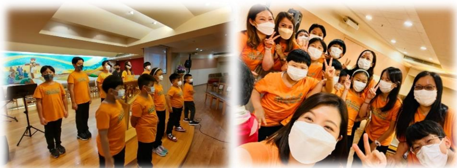
兒童聖樂詠團第一次外出服侍