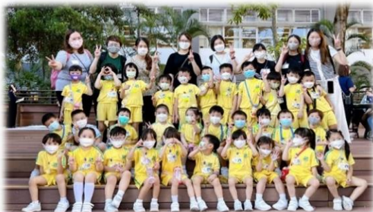
參與由沙田專業學院 舉辦之 We Park 遊戲日