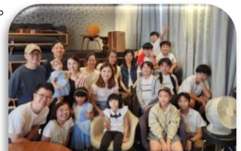
與玻璃海同工們合照