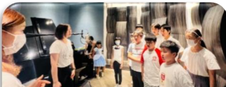
各團員齊心努力為詩歌「一生愛祢」錄音