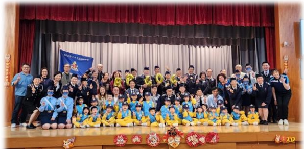
香港基督少年軍第404分隊小綿羊組別成立