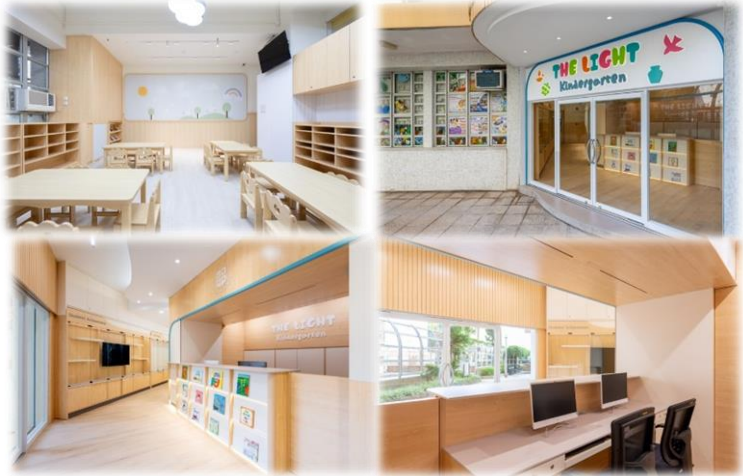
左上裝修後班房的樣貌；右上學校大門的設計； 左下由接待處到班房走廊，右下接待處職員接待的位置