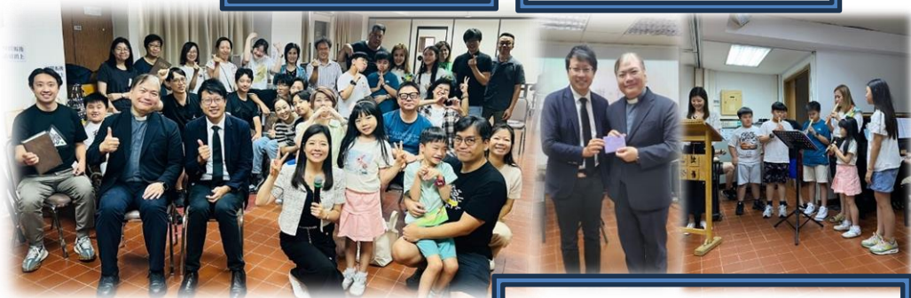
兒童聖樂詠團小朋友作牧童笛獻奏