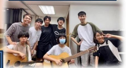
導師與隊員們一起同行