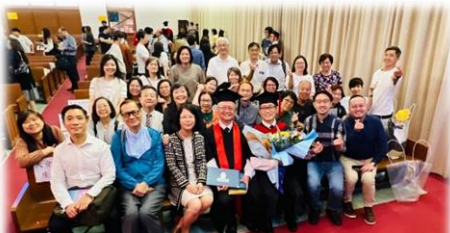
教會眾教牧長執肢體出席典禮，同頌主恩