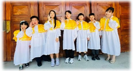
詠團於教育主日中獻唱