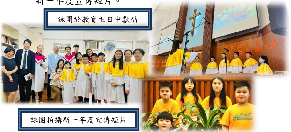
詠團拍攝新一年度宣傳短片