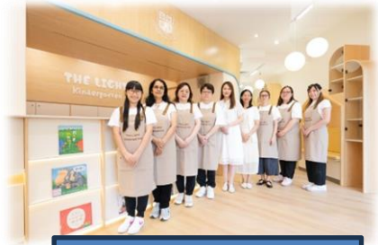
校長與一眾老師 在新裝修的辦公室外合照