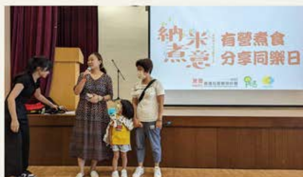
食譜發佈及分享會