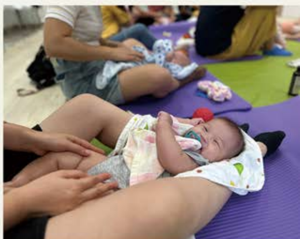
精神健康工作坊 - 嬰兒按摩技巧

項目亦致力推動婦女互助支援網絡，舉辦「朋輩支援工作人員培訓課程」、「產後婦女朋輩支援服務」等配合目標以外，亦成立同路人互助小組，建立達50個「Whatsapp營養記錄群組」，成員包括兒童家長、項目同工、營養師等，家長執行嬰幼兒營養方案時如有疑問，得以更有效分享及解答。