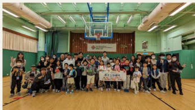
與理工大學服務學習科目合辦職業體驗活動日