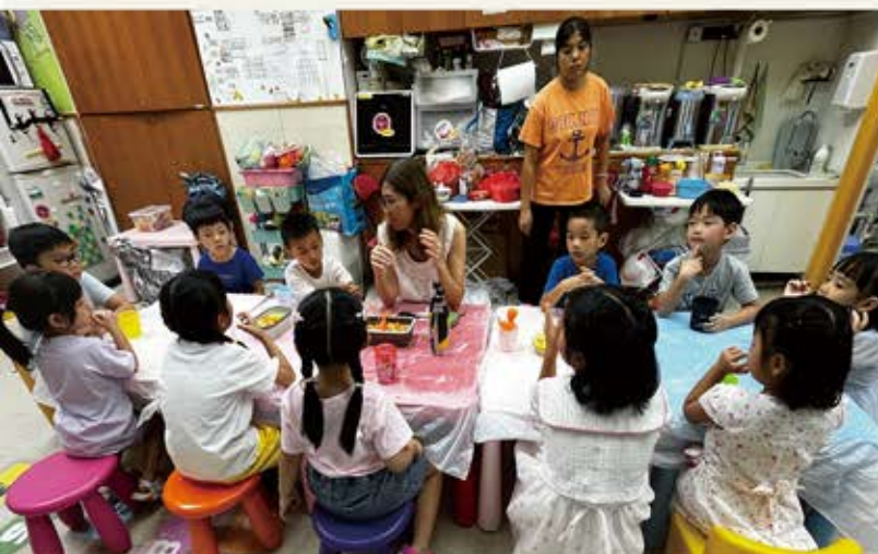
託管日常活動：夏日飲品齊齊整

此外，家長亦關注兒童升小後的課餘託管服務。藉著政府在2023年9月進行「在校課餘託管試驗計劃」家長意見收集前，透過問卷調查，向128位兒童照顧者收集他們對升小課餘託管服務的需要，並在區內舉辦分享會。