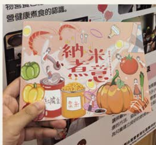
相關煮食小冊子 已分享各機構及康健中心