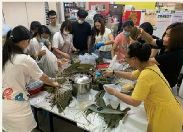
義工合力包糰送社區

此外，透過街站宣傳、社區展覽、煲湯煮食小組、義工嘉許禮暨分享會活動，加強義工對項目的投入、參與外，也向社區傳遞共建社區互助的訊息。