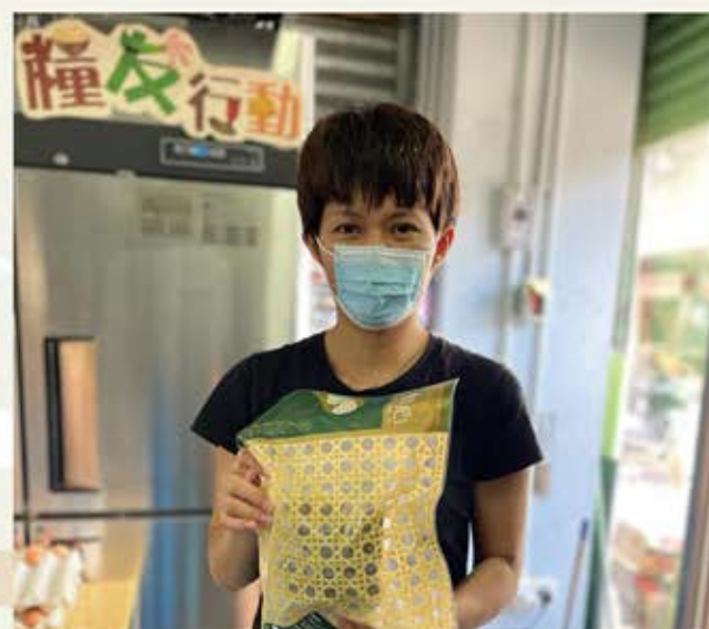
於端午節前派發捐贈的糴