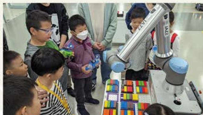
參觀大學的電腦工程設施