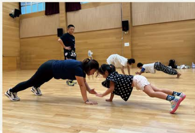
泰營泰拳班： 邀請了泰拳導師教授基本泰拳知識/姿勢，過程 中親子之間互相支持與鼓