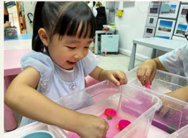
託管日常活動：美勞學習