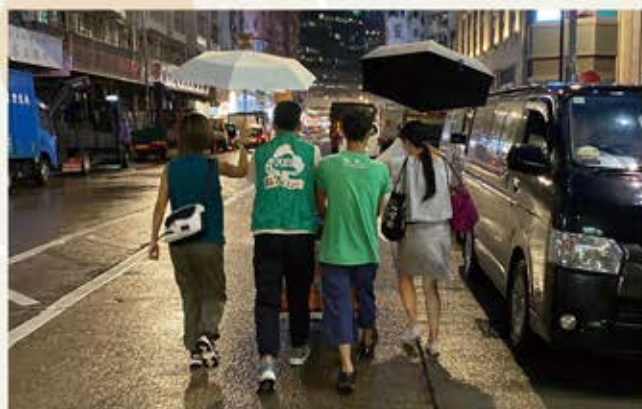
在雨天下出發到街市回收