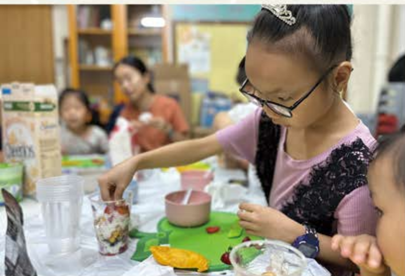
乳你童酪： 營養師講解不同食材的營養及配搭， 教導親子自行製作乳酪。