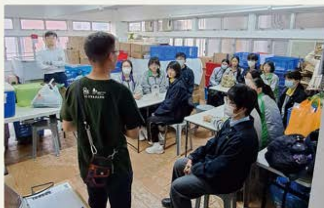
新油尖旺計劃中心正式使用