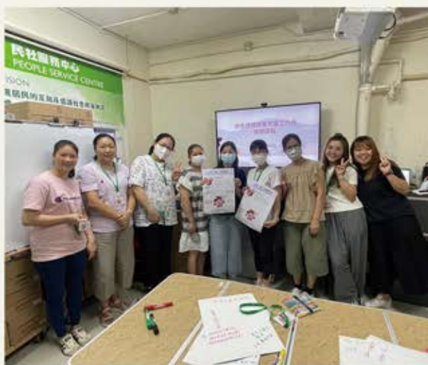
朋輩支援工作人員培訓