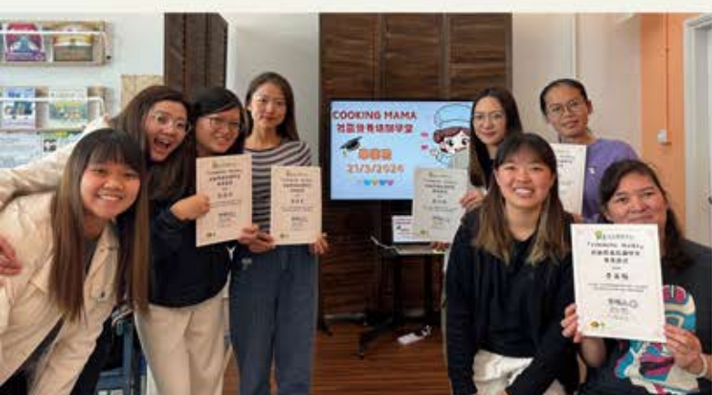
家長營養大使培訓

項目以提升家長管理兒童膳食的知識及技巧，並促進家長成為社區營養支援服務的推動者為目標。