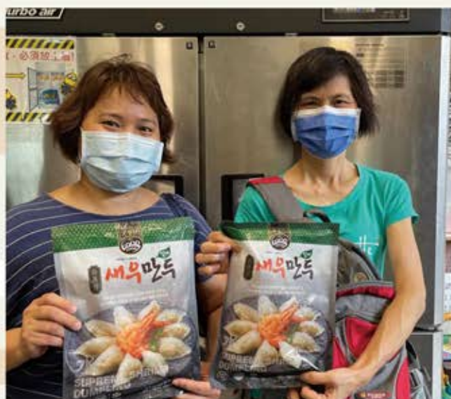
派發捐贈的不同國家食物