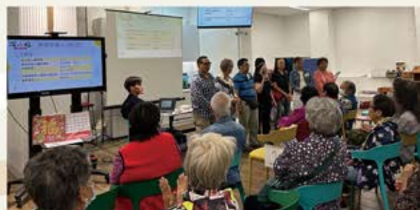
經會員大會投票成立時間銀行第一屆執委會