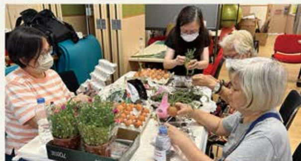
會員可用時分換取其他會員分享的手工作藝品