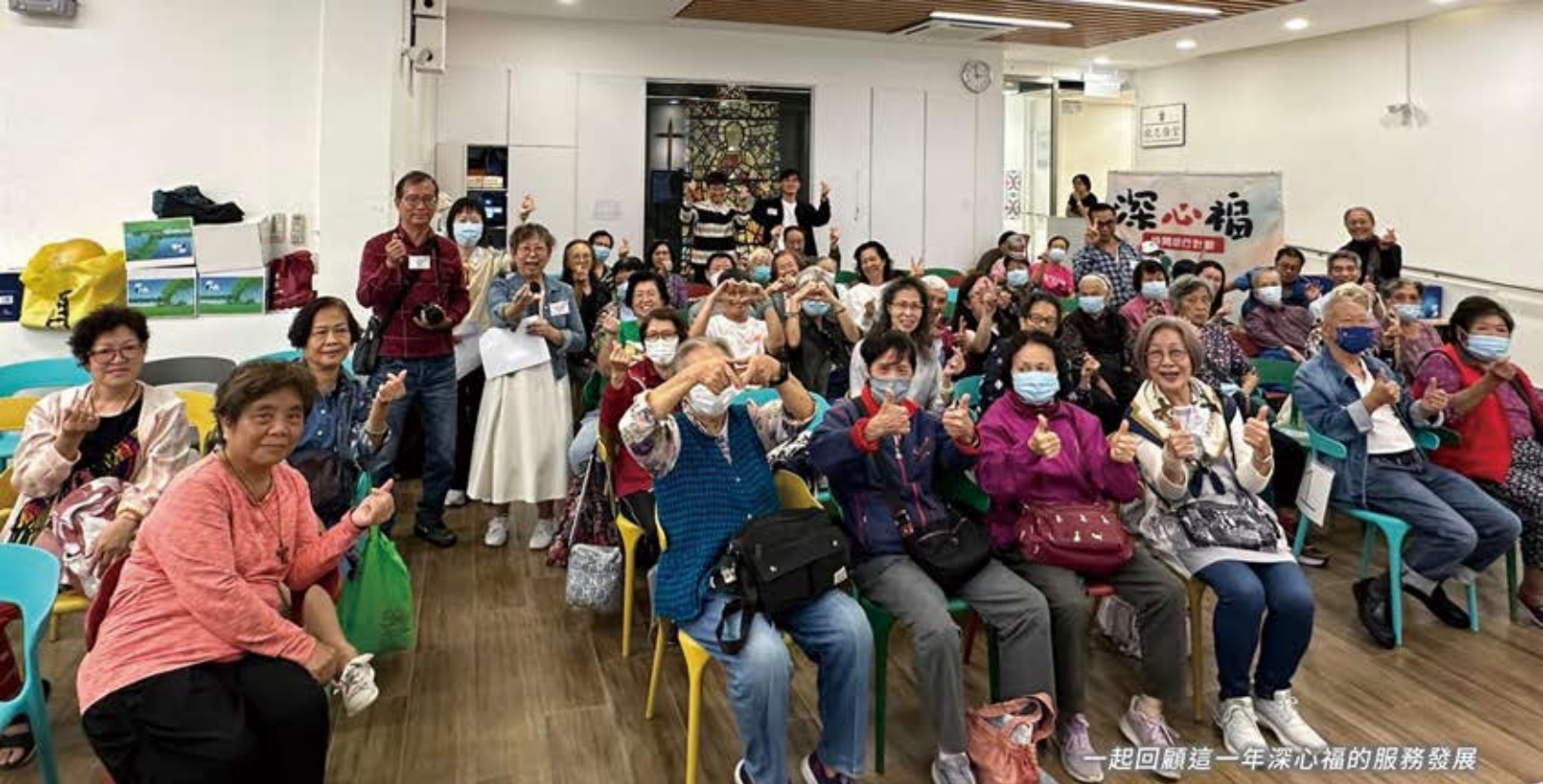
一起回顧這一年深心福的服務發展