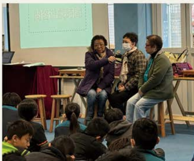
於沙田圓胡素貞小學 舉辦分享會