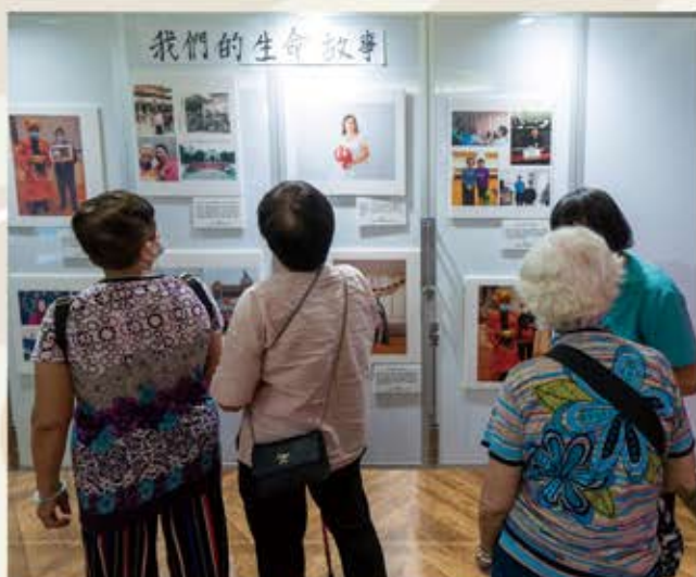
於香港浸會大學舉辦 「論耆一生·生命教育展覽」