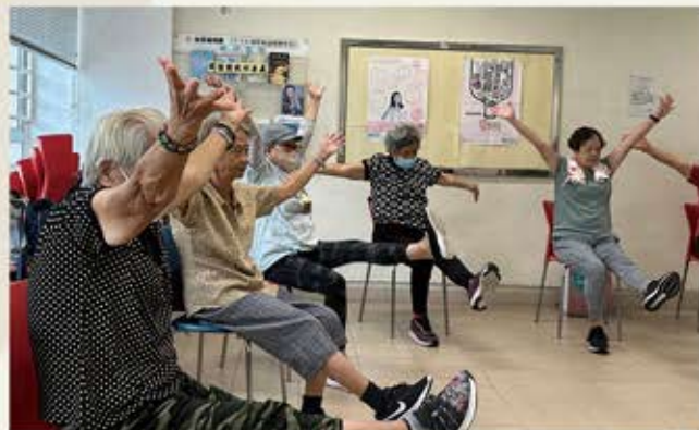
坐式運動互助小組