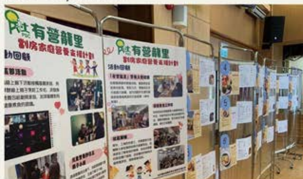
由街坊投票選出各個菜式獎項

此外，項目的「周大福先導計劃」與社區內17間小店合作舉辦折扣券計劃，向有需要家庭送贈各間社區小店的購物券，亦向200名會員派發「有營」材料包，促進社區關懷網絡及著重營養飲食的氣氛。