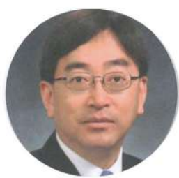
榮譽會長 高永文醫生