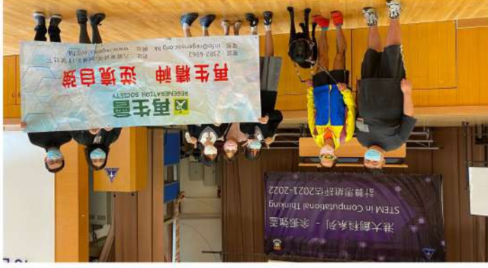
勇士生命故事分享： 日期：2021年12月7日 地點：余振強紀念中學 講者：梁小偉先生 (第20屆再生勇士)