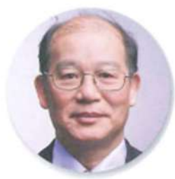
副總理 林信義先生