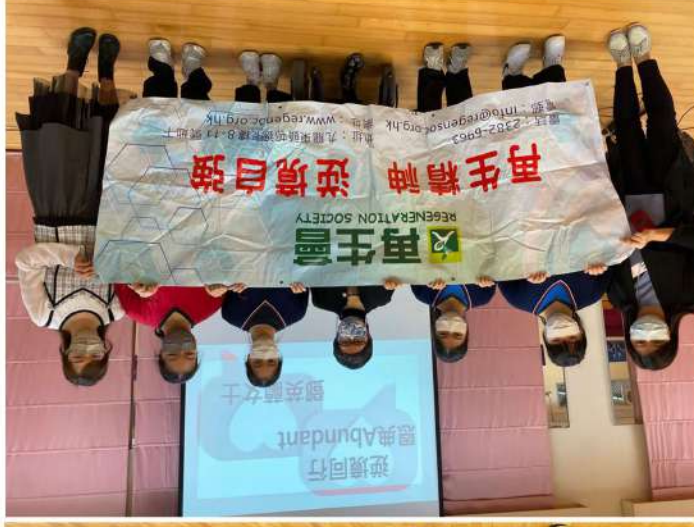
勇士生命故事分享： 日期：2021年11月19日 地點：五旬節林漢光中學 講者：鄧英蘭女士 (第十四屆再生勇士)