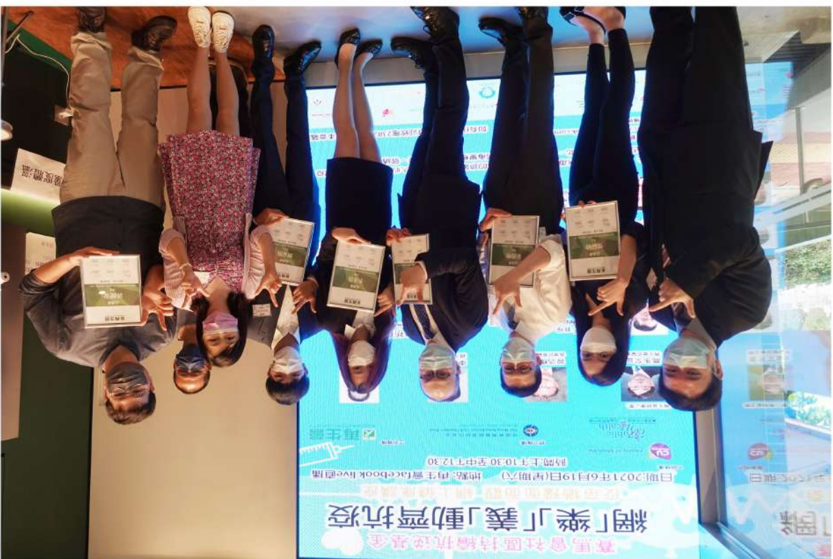
2021年6月19日網「樂」義「動」齊「疫」之「疫苗猶豫面面觀」網上健康講座。再生會特別鳴謝郭健安教授、曾祈殷醫生、崔俊明藥劑師、鄭倩敏女士、黃至生教授(大會主持人)、劉家滔先生、李彥熹小姐擔任主講嘉賓。