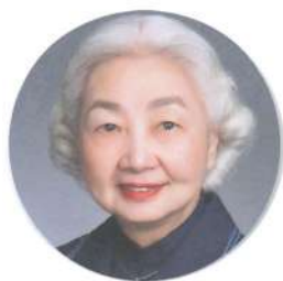
名譽贊助人 梁愛詩女士