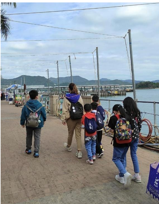
『東涌小記者』 - 西貢環保體驗篇