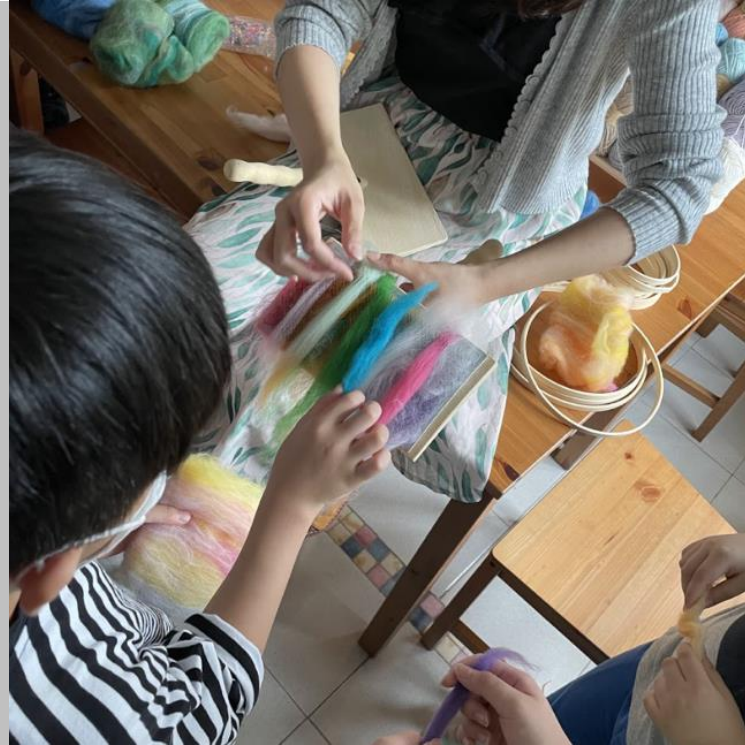
手工紡紗 x 捕夢網體驗工作坊