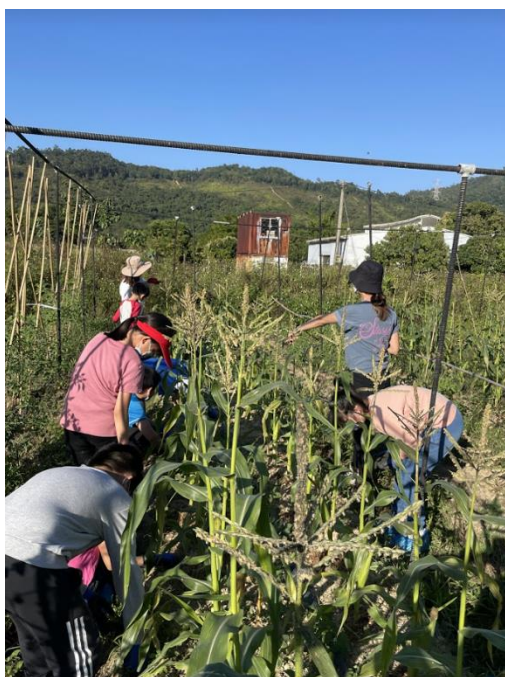
『東涌小記者』-元朗農業篇