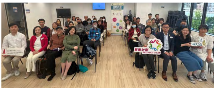
【星動計劃】Chill Talk Tour - 「社會服務共建共創」實踐分享