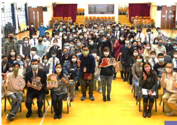
第9批兒童發展基金計劃啟動禮正式啟動