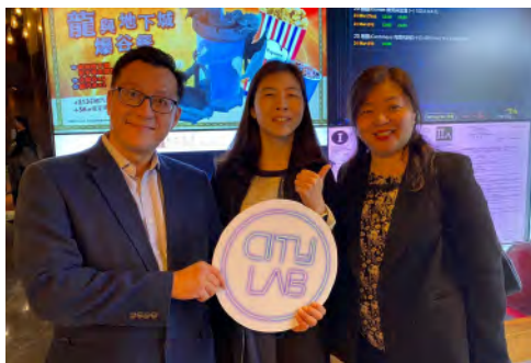
<流水落花>電影包場活動