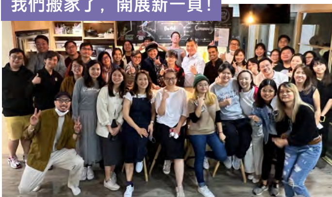
「同行伙伴」參加歡送派對