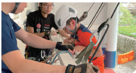
進念思維領袖計劃