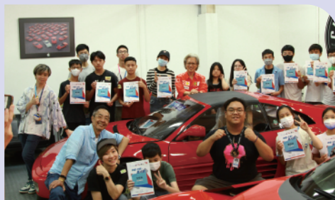
汽車美容職場導覽

是次合作計劃為三個階段進行，包括：「職場導覽」、「工作體驗」與「進入職場」，十多名參與的青年人，他們親身體驗經營與管理小企、市場營銷與推廣、古董車美容與保養等專業的行業資訊，認識了相關的發展機遇，以擴闊他們的職涯規劃和視野。