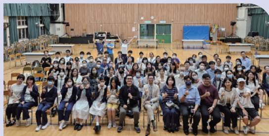
第八批兒童發展基金 第二年分享會

至於，第九批兒童發展基金計劃的500多名學生已順利完成第一年活動，目前正進行第二年的學習，從理財到嘗試策劃合適的活動給有需要的群體。在過程中，學生在財務管理、人際溝通和合作上都得到豐富的經驗，亦學習敢於面對挑戰和克服困難。