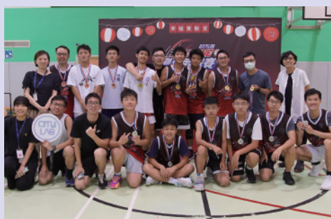
All In One 聯校籃球賽

是次聯校籃球賽於7月29日圓滿結束，共有13間學校，合共24支男女子師友隊伍參賽。當天各校參賽隊員實力相當，竭盡全力參賽。比賽過程中，他們不僅切磋技藝，還彼此鼓勵，場外的助威聲勢更是熱鬧非凡。我們還邀請了兩位甲一聯賽球員參與開球禮和與同學交流球技，他們更分享了自己成為籃球員的心路歷程，以此勉勵同學勇敢地追尋夢想與目標。