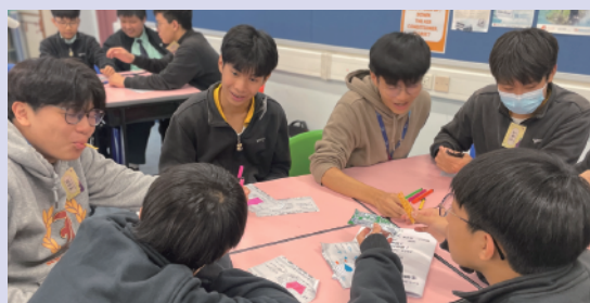
進念理財訓練工作坊