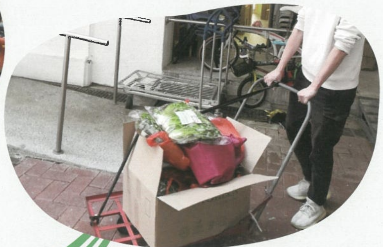
第五波疫情期間組織義工自發為確診家庭運送各類物資。