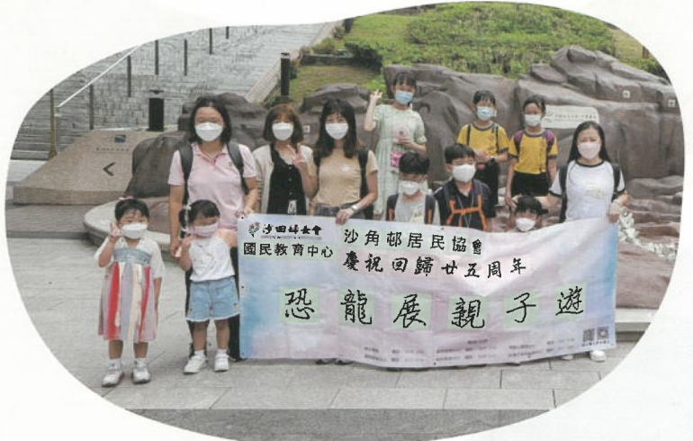
每年舉辦多姿多彩的暑假活動，圖為帶領區內親子家庭參觀新落成的科學館恐龍展。