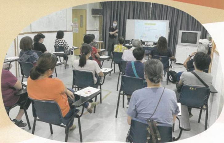
急救教育講座，為市民增添急救知識。