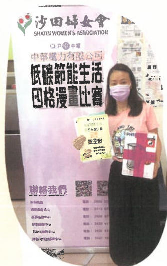
節能四格漫畫 比賽得獎

同時中心亦負責跟進劏房戶居住環境改善計劃，幫助合資格的申請人向社聯申請基金購買家具家電或改善居住環境。至 2021 年底，已處理近百個劏房戶個案。