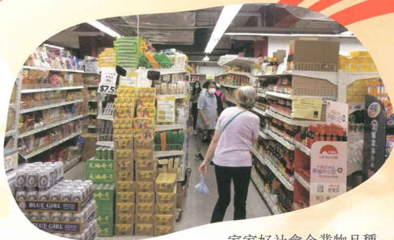
家家好社會企業物品種類繁多

地址：沙田馬鞍山耀安邨耀和樓 27-32 號地下 營業時間：上午 8 時至晚上 10 時 (星期一至星期日) 電話：2633 3390 傳真：2633 3349