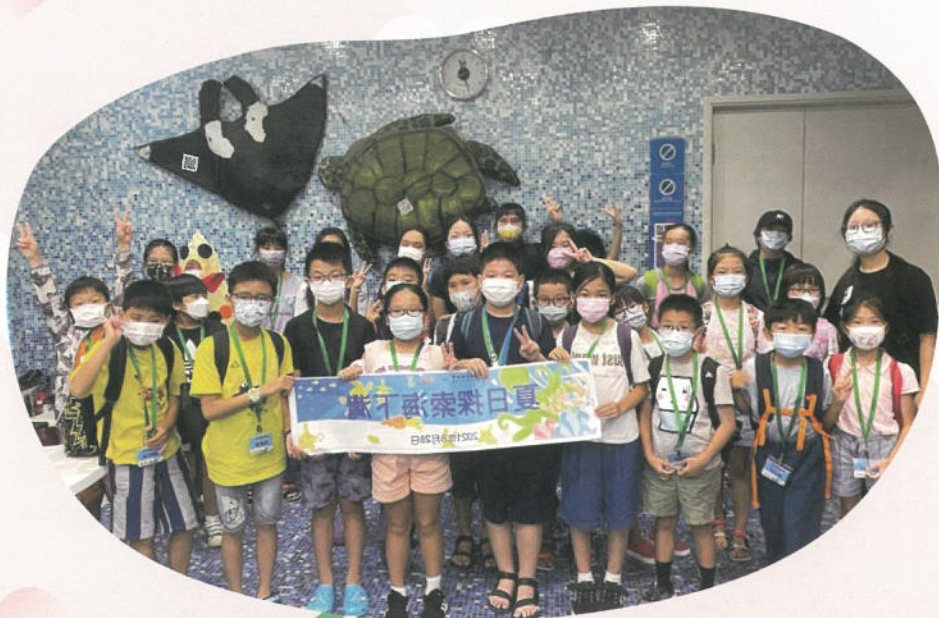
帶領兒童前往西項海下灣，探索海洋世界的奧秘。