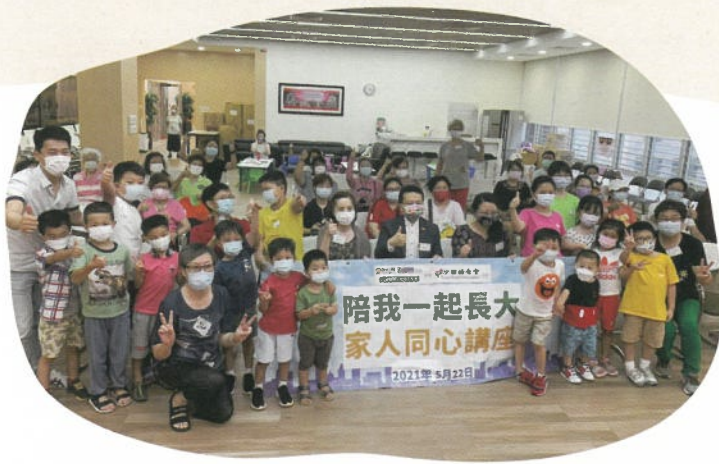
陪我一起長大，家人同心講座