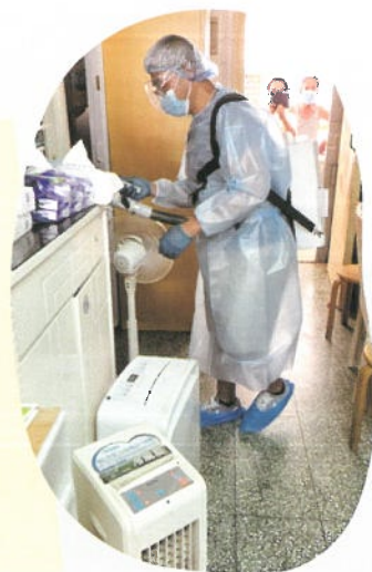
到年長會員家中協助消毒，防止新冠病毒在社區擴散。