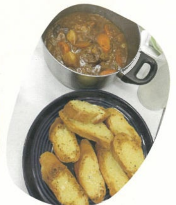
點心員製作基礎證書 - 課堂作品