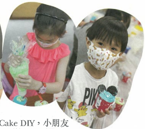
復活節 Cup Cake DIY，小朋友親製 Cup Cake 增添節日氣氛。