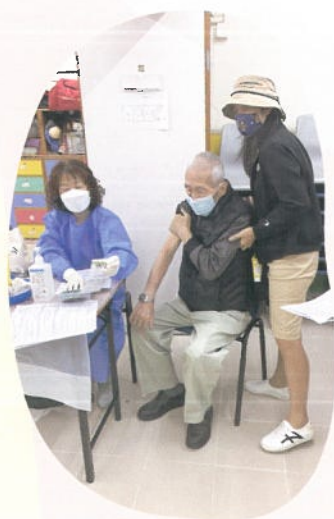
流感疫曲注射服務

會員及義工一直是瀝源服務中心不可或缺的重要資產，助我們在各種活動及中心發展上佔一個重要的支柱。因此，我們參加了由香港公共圖書館與非牟利社區組織合力發展的「便利圖書站－社區圖書館伙伴計劃」，故中心向香港公共圖書館外借了約二百本的成人及兒童書籍，供會員及義工閒時閱讀書籍，同時也可提升他們歸屬感。