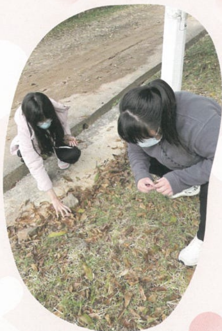
原野烹飪利用大自然材料生火烹煮的樂趣。