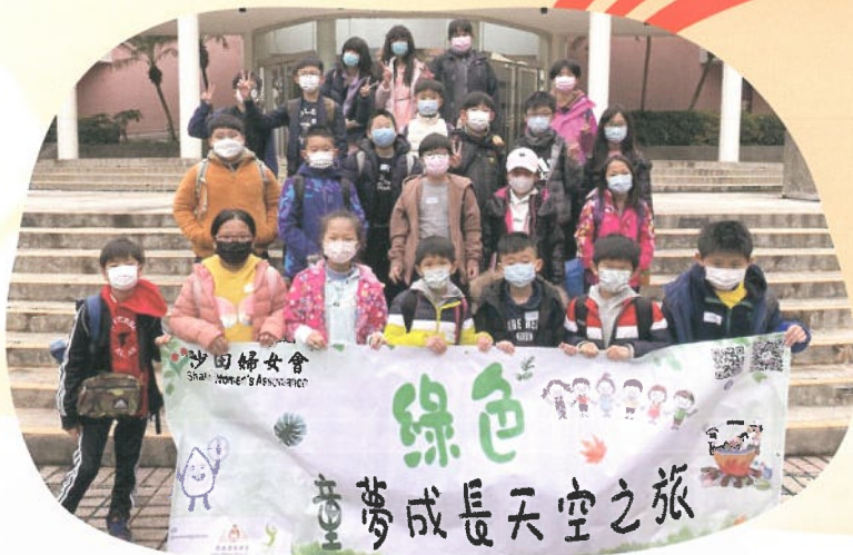
綠色童夢成長天空之 旅活動大合照

地址：馬鞍山利安邨利榮樓地下 A 翼 電話：2633 4111 傳真：2633 5111 電郵：leeson@swa.org.hk