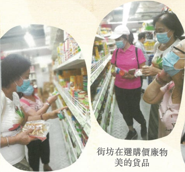
街坊在選購價廉物美 的貨品