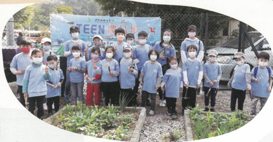
手握工具 準備就緒