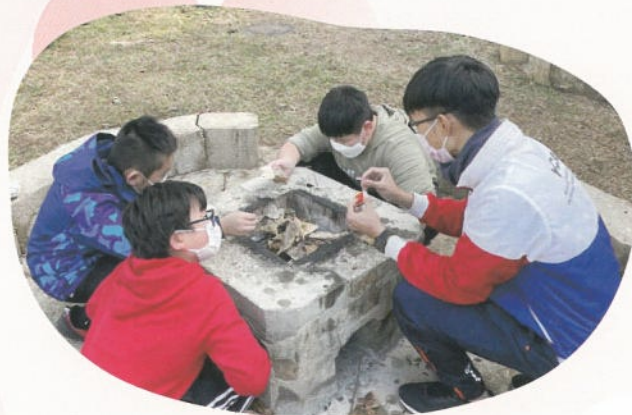
原野烹飪利用大自然材料生火烹煮的樂趣。