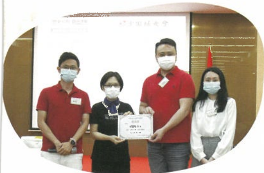
執屋大作戰，斷、捨、離講座