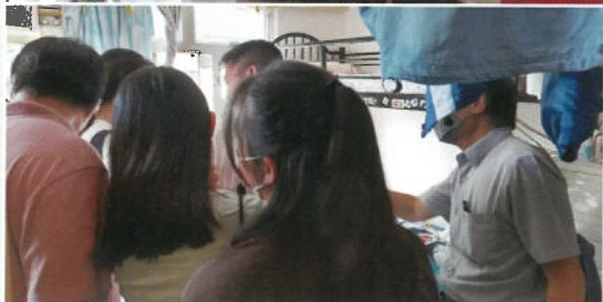
社會服務部梁社工帶領 學生探訪劏房戶