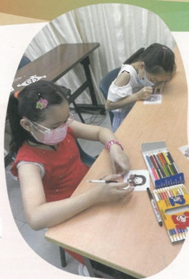
匙扣工作坊，讓小朋友發揮小宇宙親手製作匙扣及增進耐性。