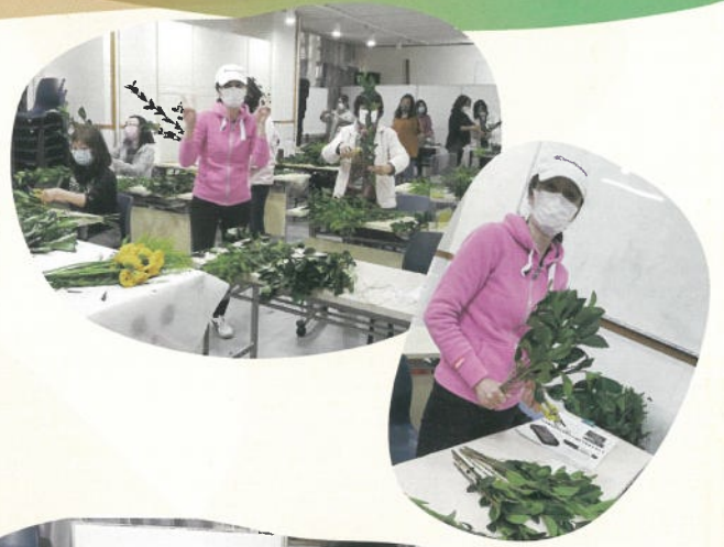
花店實務及花藝設計助課程