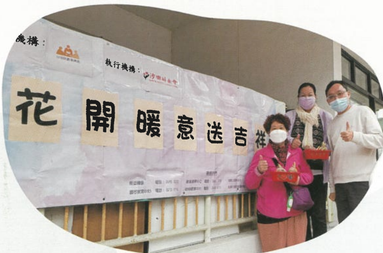
送贈應節水仙花苞給區內弱勢社群。