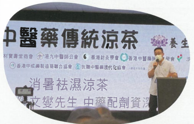
與中醫團體合辦中醫養生講座，普及我國傳統中醫和養生、「防未病」哲學。