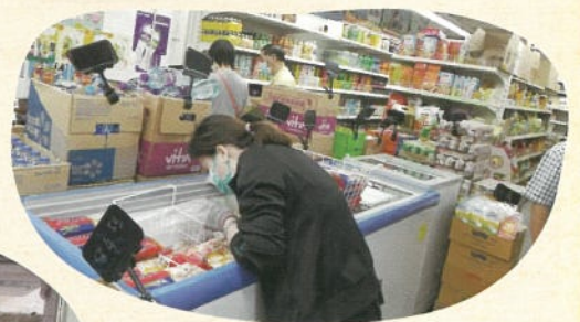
家家好社會企業物 品種類繁多

疫情期間，上班第一個工作是不停把貨品上架，有時因人手所限，貨品未上架已經被搶購一空。在採購上需要花更多的時間，因為很多供應商已經缺貨，家家好只有著力去找尋另一些仍有存貨的供應商提供貨品，以處理街坊燃眉之急。雖然批發價提升了，成本上升了，但家家好並沒有因此而調高貨品價格，因為我們明白這些都是社會企業需要履行的社會責任。