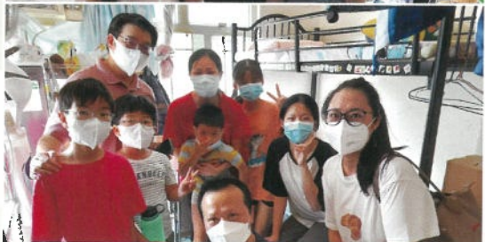
探訪劏房戶合照留念