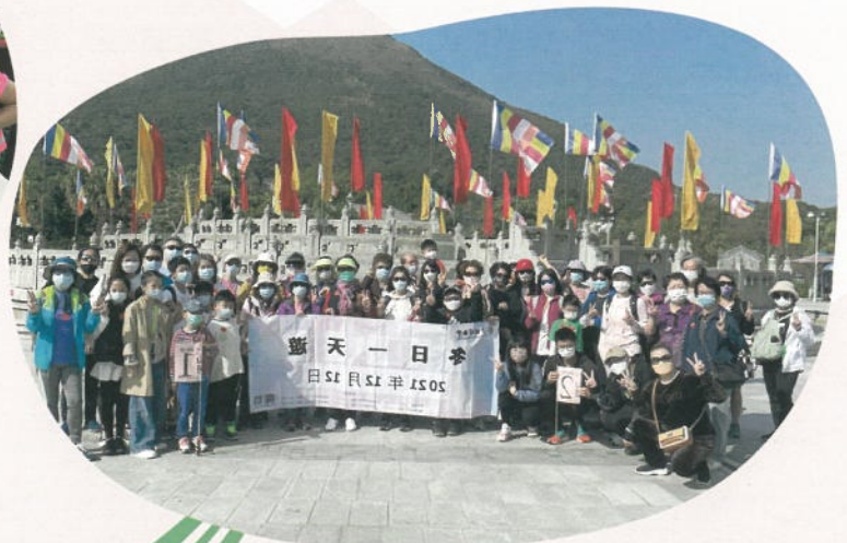
遊覽大嶼山名勝之冬日一天遊