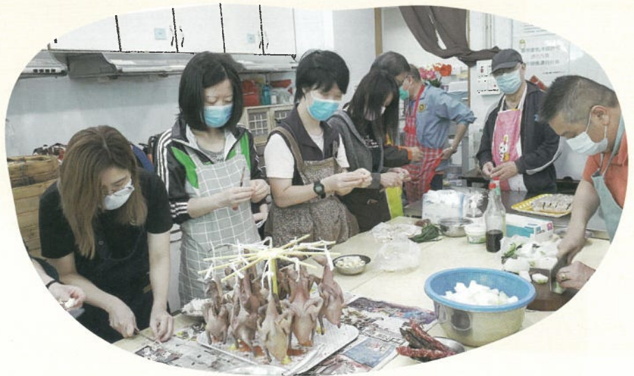
茶餐廳廚吧助理基礎證書班上課情況，學習製作烤乳鴿。