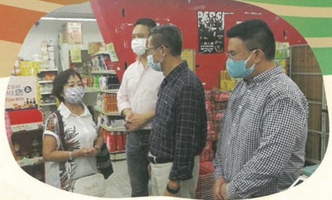
香港特別行政區財政司司長 陳茂波先生到訪參觀