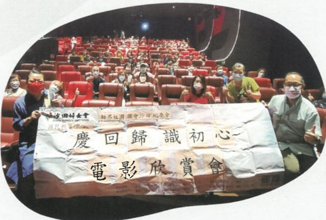
舉辦國情電影欣賞會，了解國家建立前的苦難歷史，培養愛國情懷。