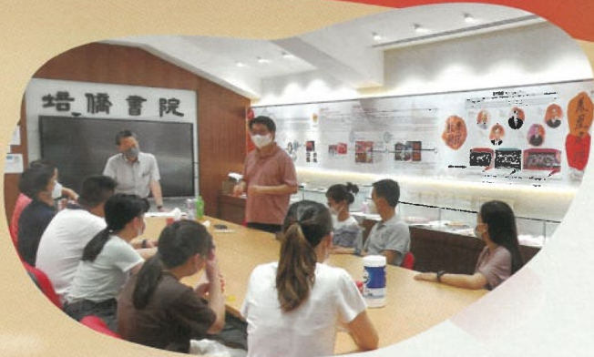
梁社工探訪劏房戶前作詳細講解