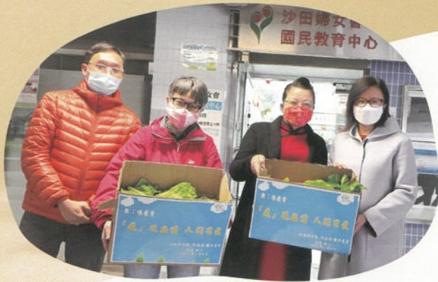
第五波疫情期間社會物資緊張，轉送愛心菜農捐贈的蔬菜給區內兒童之家。