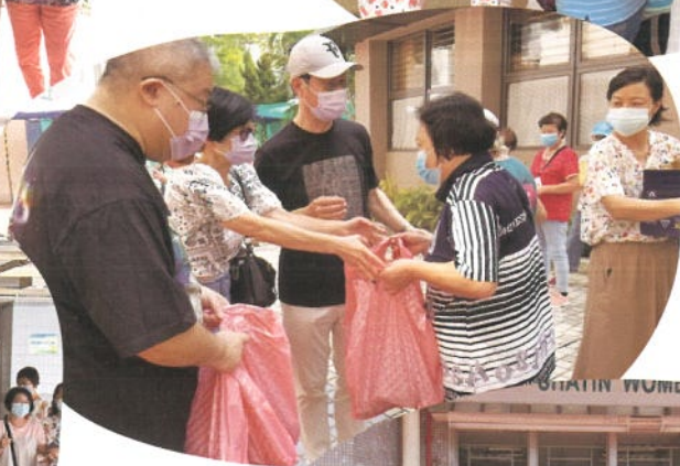
秋月滿沙田 福袋贈耆英