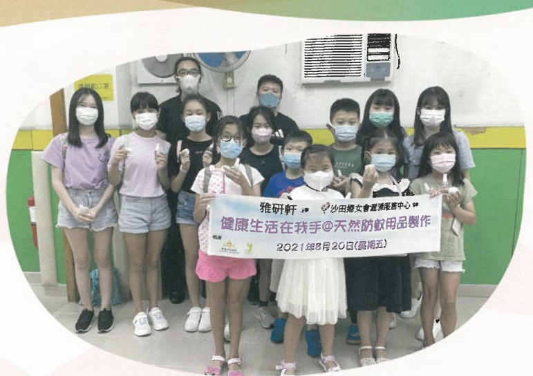
健康生活在我手 @ 天然防蚊用品製作