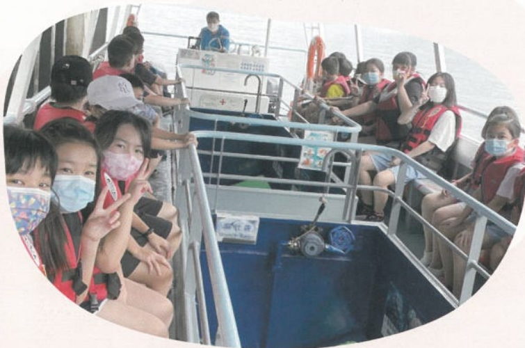
帶領兒童前往西項海下灣，探索海洋世界的奧秘。