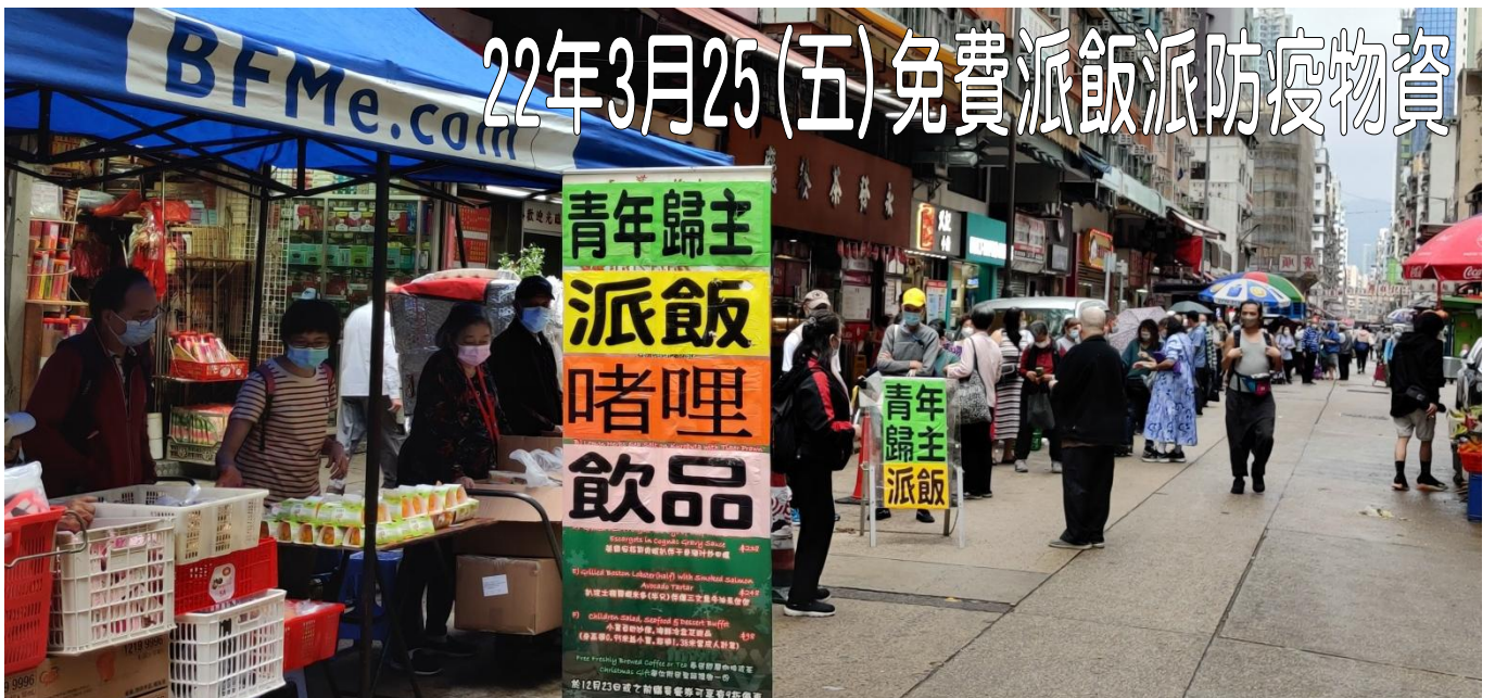
22年3月25 (五) 免費派飯派防疫物資