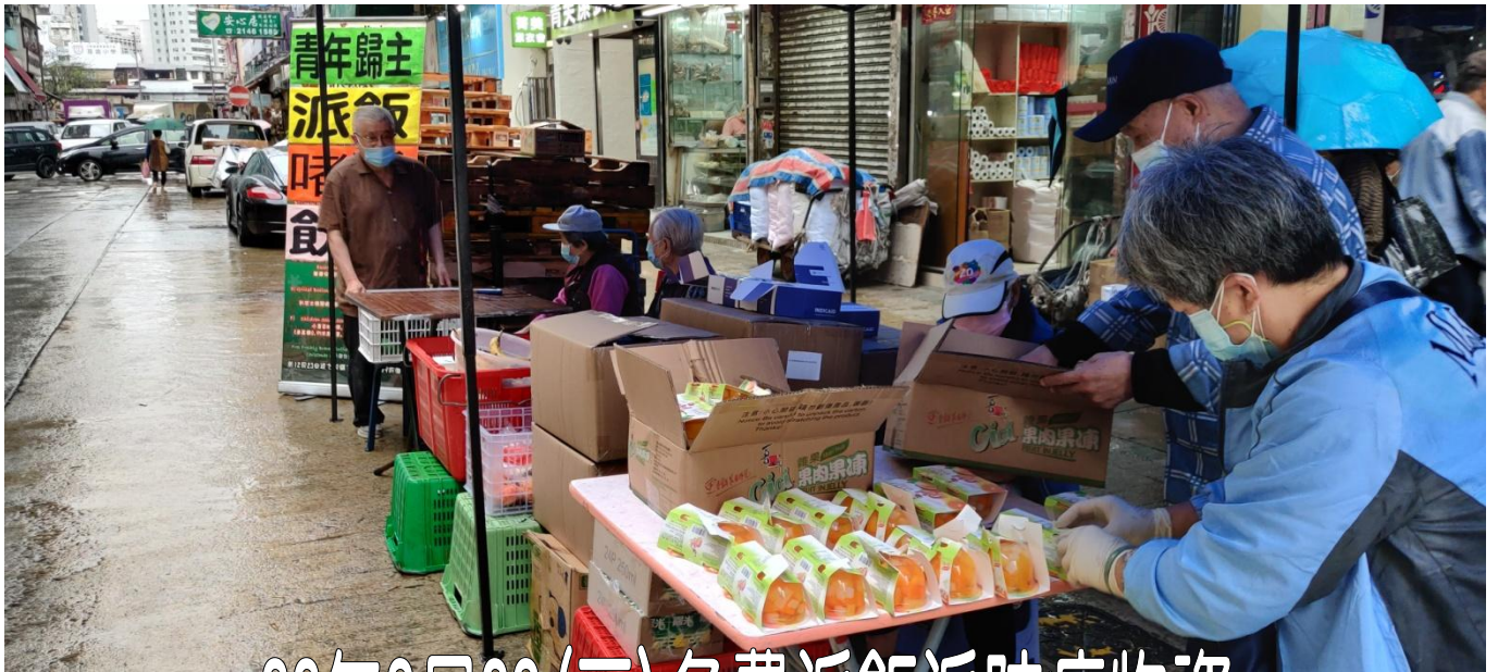
22年3月23 (三) 免費派飯派防疫物資